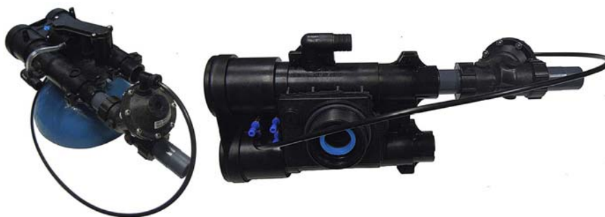
- Disegno 3 -