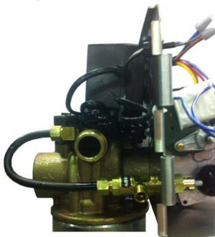
Valvola Salamoia 1600